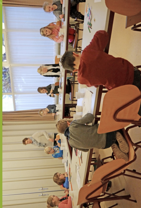
De kinderen van jeugdclub "de Start"

We vragen daarom ook nu weer om uw/jouw steun, zodat we als gemeente aan onze (financiële) verplichtingen kunnen voldoen. We willen ook in de toekomst samen kerk zijn. Een gemeente waar we GOD mogen ontmoeten, ieder op zijn of haar manier.