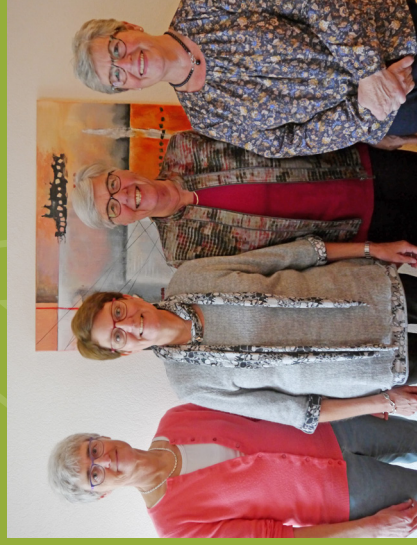
Dames van het verjaardagsfonds

Dat is echter niet voldoende om de kerk in financieel opzicht in stand te houden.